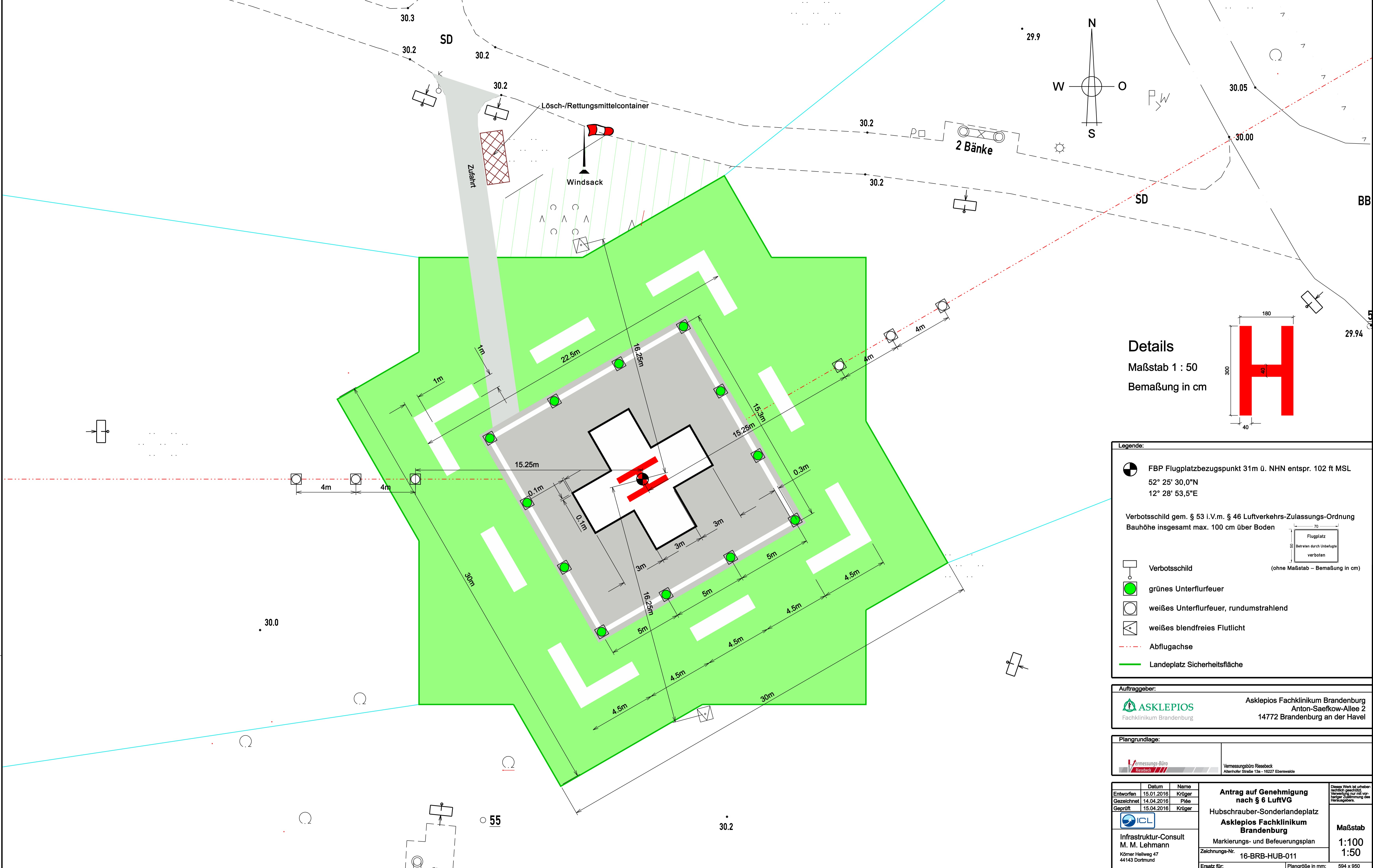
Details Maßstab 1 : 50 Bemaßung in cm